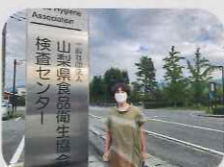
(やまなし環境財団助成金を活用)