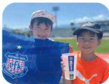
(パルシステム山梨長野野市民活動助成金を活用)

ヴァンフォーレ甲府が、スタジアムでのリユース食器業務を担当する新たな運営体制がスタート。