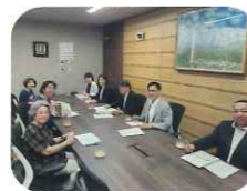
(休職預金等活用事業助成金を活用)

産後ママ等にお弁当を届ける事業が、2024年春より、富士川町の新事業として継続決定。